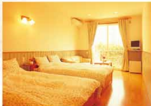
ツインルーム (25平米・ダブルベッド2台) 定員4名様まで

シンプルで開放的なリゾートルーム 南向きの窓からは心地よい海風 夜には水平線に灯る漁り火と星空 海が演出する情緒を のんびり楽しんでください。