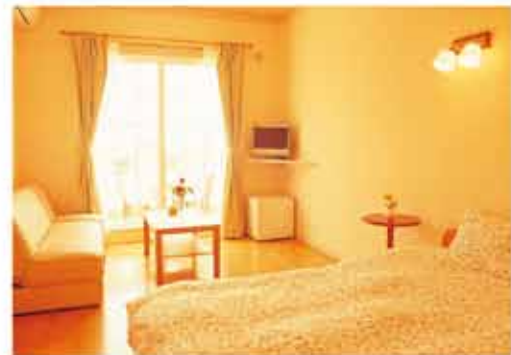
ダブルルーム (20平米+バルコニー) 定員2名様まで