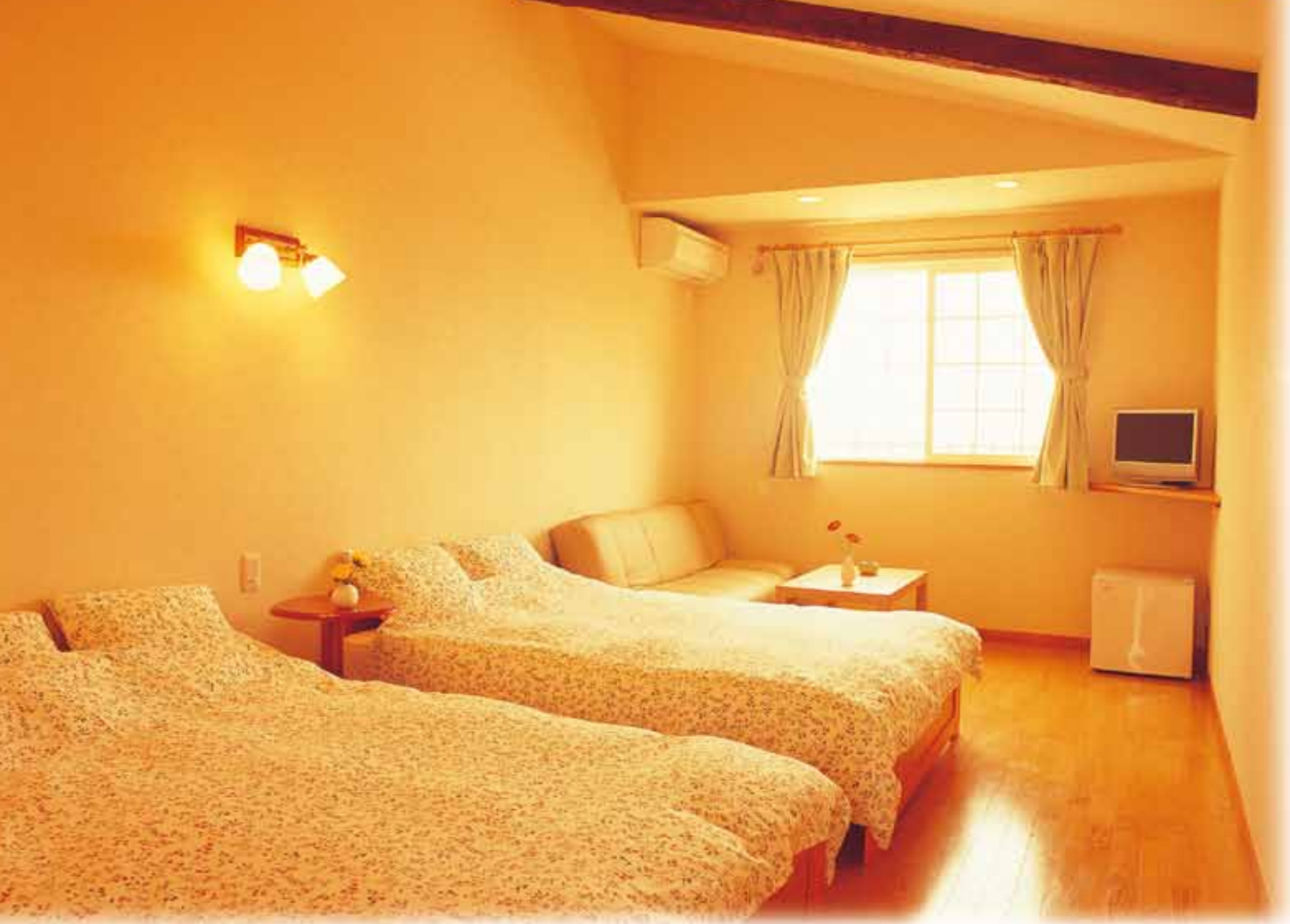
ツインルーム (25平米・ダブルベッド2台) 定員4名様まで